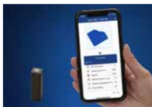
Jednostki pomiarowe i testowe firmy IST METZ