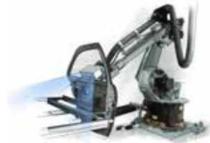
Lakierowanie elementów 2D i 3D