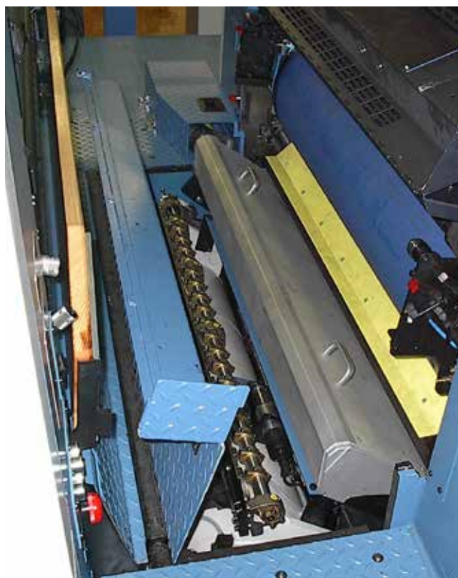
Utwardzanie UV na zespołach drukujących