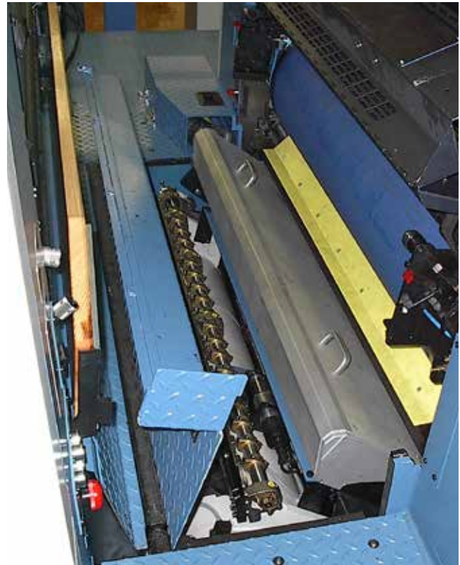
IST UV Zwischen Trocknung