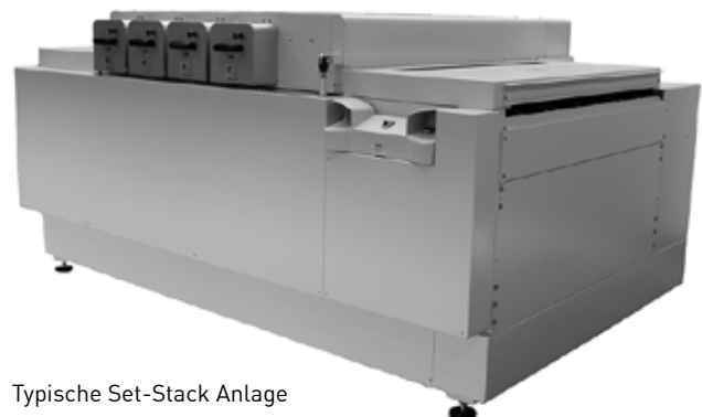
Typische Set-Stack Anlage