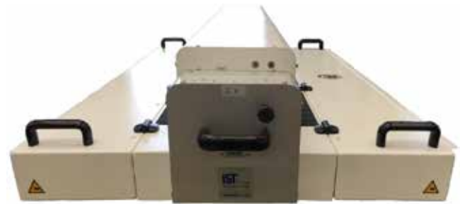
IST UV Zwischenrocknung