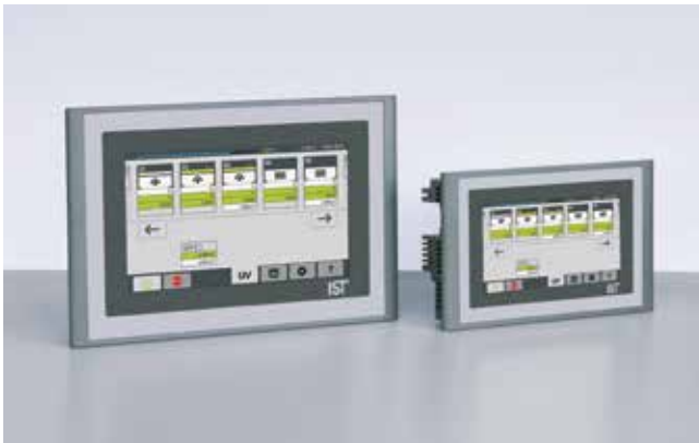
UV-Anlagenbedienung Smart Control