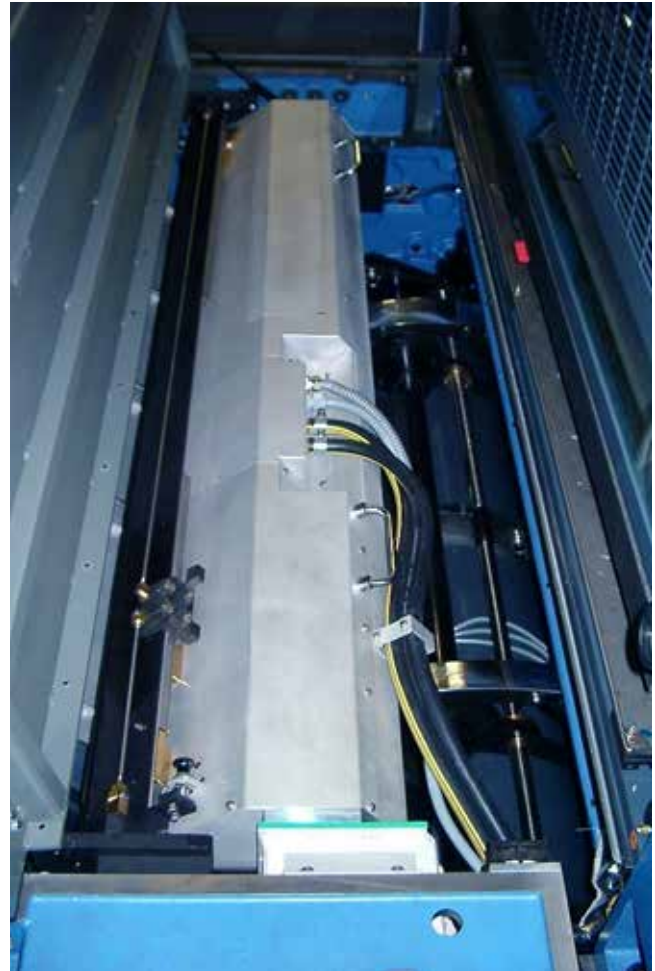
IST UV Zwischentrocknung