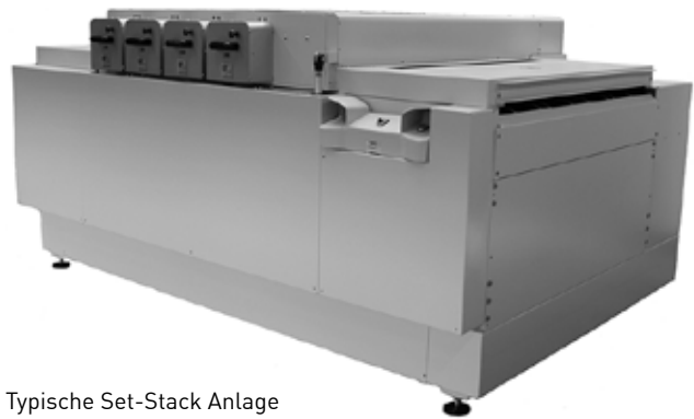
Typische Set-Stack Anlage