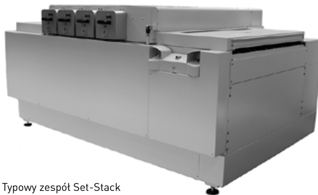
Typowy zespół Set-Stack