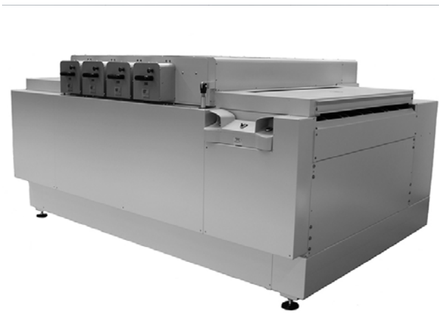
Typische Set-Stack Anlage