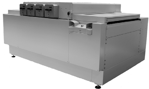
Typische Set-Stack Anlage

F803 11/17 DE Technische Änderungen vorbehalten Mit ® gekennzeichnete Produkte sind eingetragene Warenzeichen von IST METZ