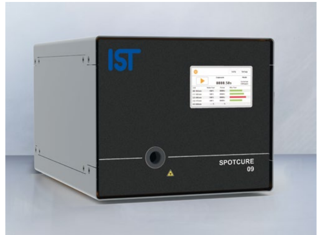
SPOTCURE 09 UV-LED-System

Eine intuitive Benutzeroberfläche sowie umfangreiche Einstellmöglichkeiten für jedes LED-Modul und allgemeine Belichtungsparameter unterstützen im Anwendungsprozess.